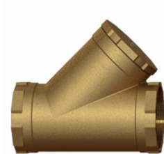
Filtro Y - Roscado

O Filtro Y da Unikap está disponível em dois modelos: