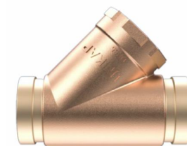
Filtro Y - Grooved