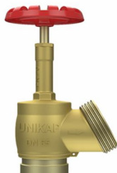
Registro Hidrante – Industrial PN20 - Grooved