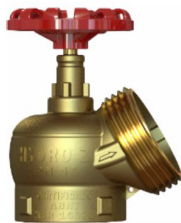
Registro Hidrante – PN16