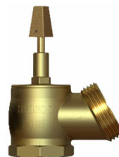
Registro Hidrante – Recalque PN16