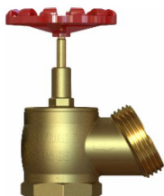
Registro Hidrante – Industrial PN16