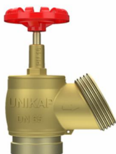
Registro Hidrante – Industrial PN16 - Grooved