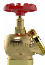
Registro Hidrante - Grooved