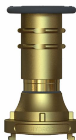
Esguicho Regulável – HZ02