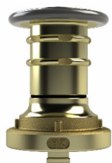
Esguicho Regulável – HZ01

O Esguicho Regulável da Unikap está disponível em dois modelos: